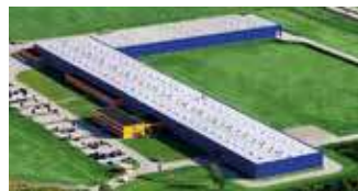
Hörmann Legnica Sp. z o.o., Polen