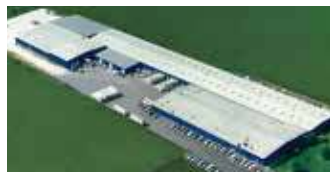
Hörmann LLC, Montgomery IL, USA